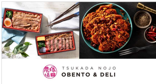
①「ペリエ千葉店」商品イメージ

3月2日より「芝浦食肉/関根精肉店」では「まるごと新玉ねぎと大とろホルモンの鉄板焼」や「新じゃがのり塩ポテト」など、「じとっこ組合(ライセンス)」では「みやざき地頭鶏とちぐさピーマンの鶏白湯 青椒肉絲」「宮崎産 新玉葱のりしお揚げ」など、春らしいメニューの提供が始まりました。季節の限定メニューは、約3ヵ月という短い期間での提供です。各ブランドの特徴ある料理をお試しいただき、お気に入りの「春」を見つけていただければ幸いです。